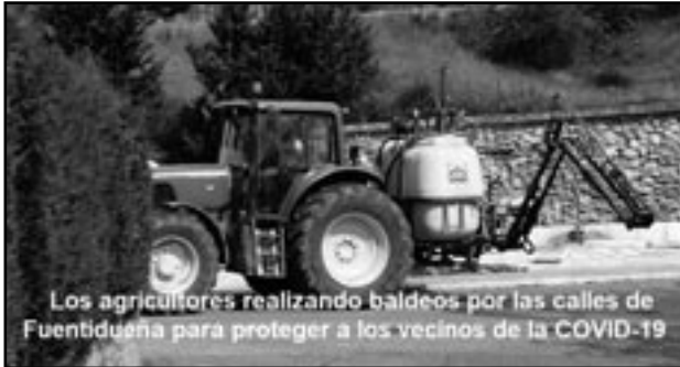
Los agricultores realizando baldeos por las calles de Fuentidueña para proteger a los vecinos de la COVID-19

Durante estas semanas, dada la situación sanitaria en la que nos encontramos, los agricultores de Fuentidueña nos pusimos en contacto con el Ayuntamiento, con el fin de colaborar con nuestro pueblo, prestando nuestra maquinaria agrícola así como cubas fertilizantes, ... y nuestro servicio para llevar la maquinaria con los tractores.