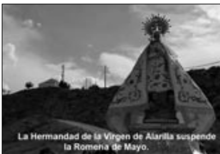
La Hermandad de la Virgen de Alarilla suspende la Romería de Mayo.

La Hermandad de la Virgen de Alarilla y la Parroquia San Andrés de Fuentidueña se adelantaron a lo que estaba por llegar.